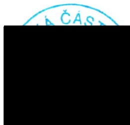
Ing. Václav Tětek vedoucí odboru

Stavební úřad upozorňuje, že toto osvědčení není správním rozhodnutím ve smyslu ust. § 67 a násl. zákona č. 500/2004 Sb, správního řádu ve znění pozdějších předpisů (dále jen správní řád), a proto se proti němu nelze odvolat.